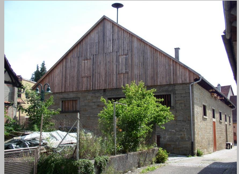
Modernisierungsmaßnahmen Hintere Straße 18 und Kelter (nachher)