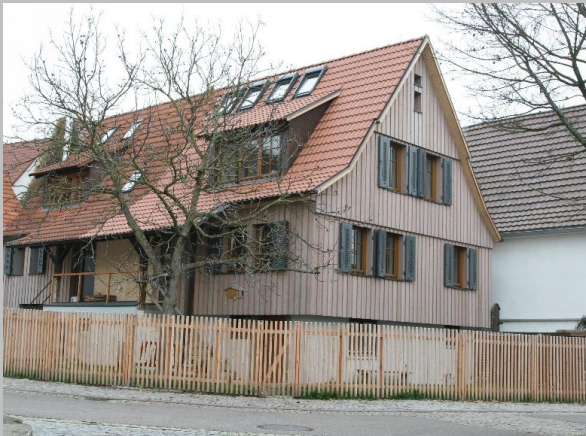
Modernisierungsmaßnahmen Rathausstraße 14 und 18 (nachher)