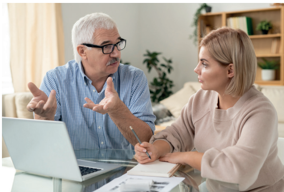
Wohnpartner und Wohnpatin im vertrauensvollen Austausch.

Im ersten Halbjahr 2025 erfolgt die Schaffung des Wohnraumangebots, im zweiten Halbjahr die Vermittlung und Begleitung.