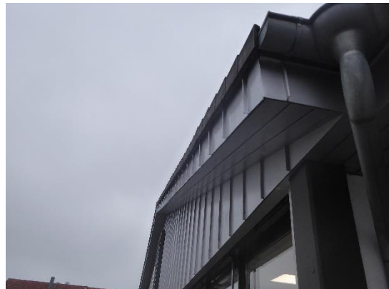
Abbildung 4: Dachvorsprung und Regenrinne mit Quartierpotenzial.