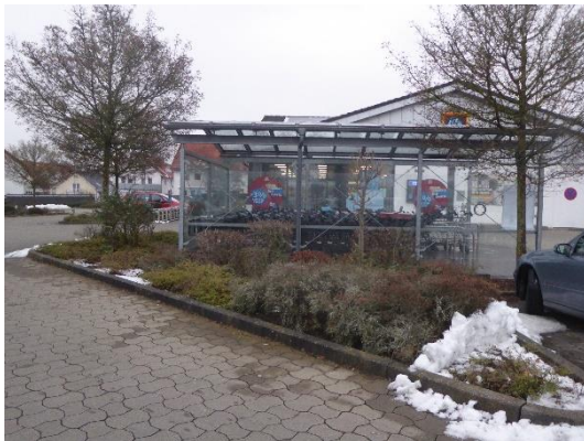
Abbildung 7: Grünstreifen zwischen den Parkflächen mit Sträuchern und Bäumen.

Weitere Habitatpotenziale für europarechtlich geschützte Arten bestehen nicht.