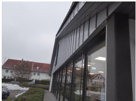
Abbildung 6: Seitenansicht des Marktes mit ähnlichem Quartierpotenzial.

⇒ Die Strukturen bieten Nistmöglichkeiten für siedlungstypische gebäudebrütende Vogelarten und Tagesquartierpotenziale für siedlungstypische Fledermausarten.