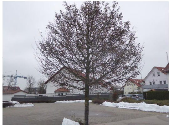
Abbildung 8: Blick auf einen für Zweigbrüter geeigneten Baum.

⇒ Die Gehölze bieten Habitatpotenzial in Form von Nistmöglichkeiten für siedlungstypische zweigbrütende Vogelarten.