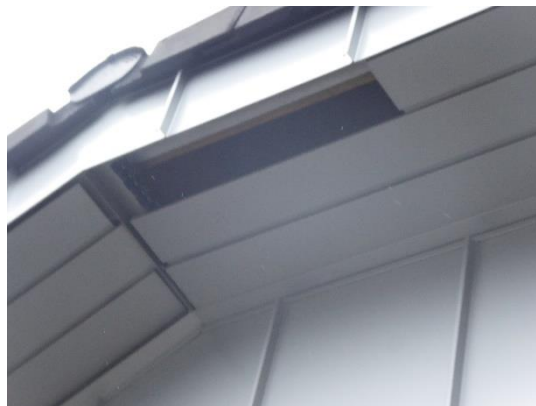
Abbildung 5: Lückig installierte bzw. fehlende Verkleidung.