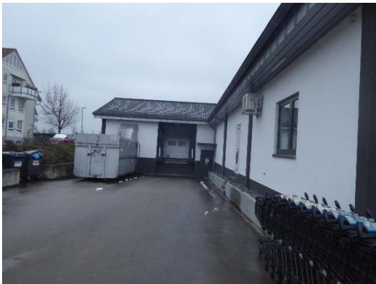
Abbildung 3: Lieferbereich hinter dem Gebäude.

Das Gebäude der ALDI-Filiale wird derzeit genutzt und liegt in randstädtischer Lage. Durch unterschiedliche Nischen sind Möglichkeiten für Nistplätze von Gebäudebrütern vorhanden und es bietet sich Potenzial für Tagesquartiere von Fledermäusen (siehe Abbildung 4).