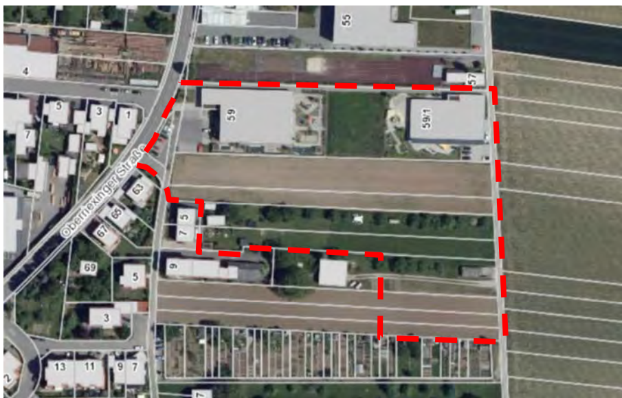
Abb. 1: Luftbild mit Abgrenzung Untersuchungsgebiet (LUBW, 2021)

Im Untersuchungsgebiet liegen Kernraum und Suchraum des Biotopverbunds mittlerer Standorte, die jedoch überwiegend überbaut sind (LUBW 2021).