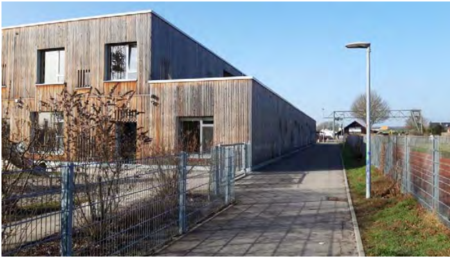
Abb. 5: Der Kindergarten im westlichen Untersuchungsgebiet