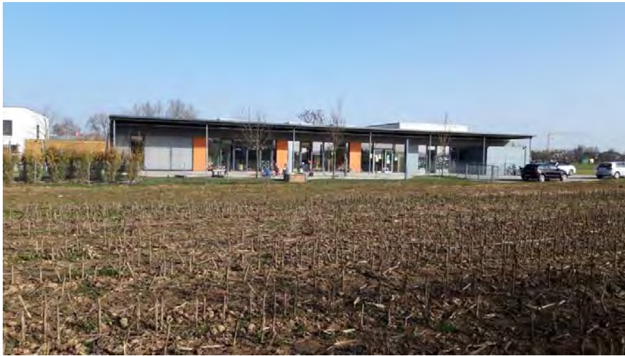
Abb. 8: Der Kindergarten im östlichen Untersuchungsgebiet