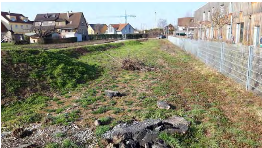
Abb. 9: Die geplante Erweiterungsfläche wird derzeit als Baustraße und Lagerfläche genutzt