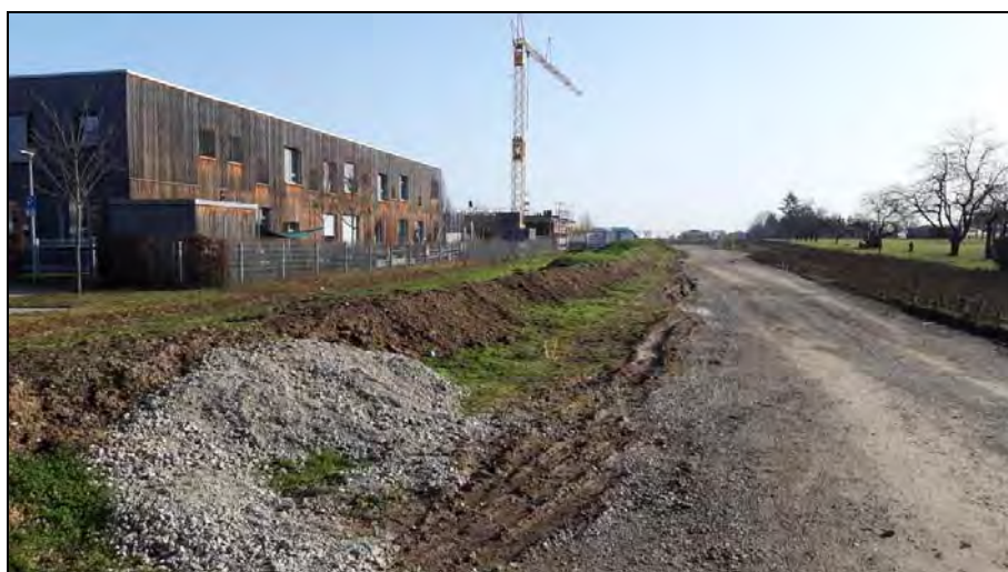
Abb. 4: Ansicht von Westen auf das Untersuchungsgebiet