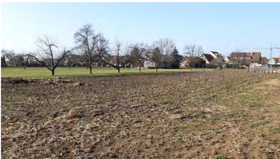
Abb. 13: Streuobstbestand auf Flst. Nr. 2485