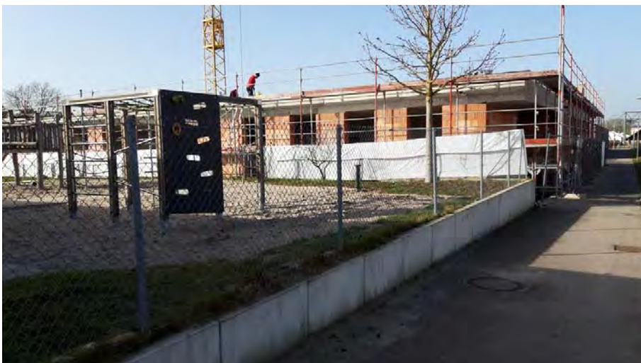
Abb. 7: Neubau auf der im Luftbild Abb. 1 noch als Wiese ausgebildeten Fläche zwischen den beiden Bestandsgebäuden