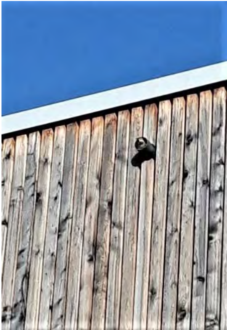
Abb. 14: Revieranzeigendes Haussperlings-Männchen in einem Lüftungsrohr an der Fassade des Kindergartens