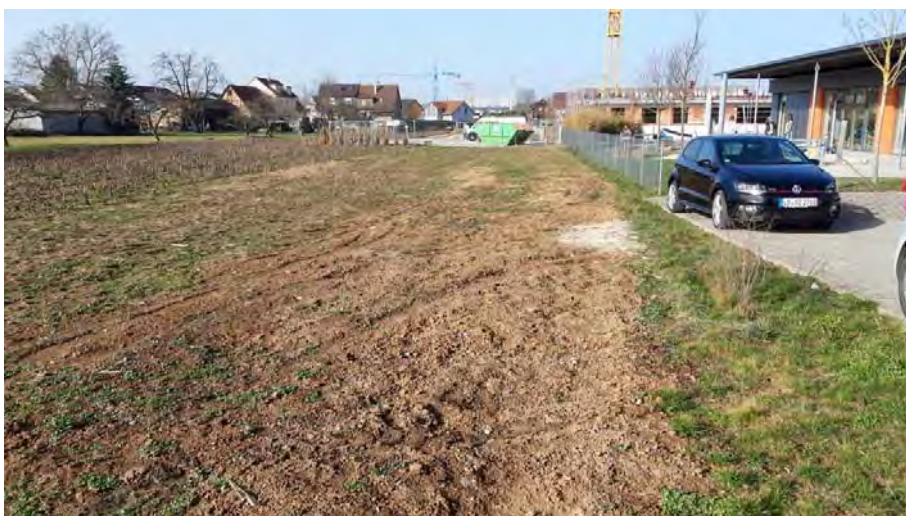
Abb. 10: Ackerbrache im östlichen Untersuchungsgebiet