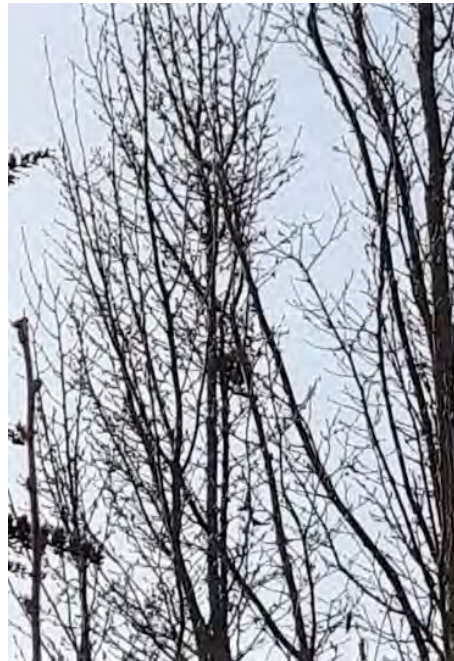
Abb. 15: Nest des Buchfinks in einem Baum in der Freifläche des Kindergartens