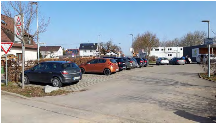
Abb. 11: Parkplätze im westlichen Untersuchungsgebiet an der „Oberriexinger Straße“