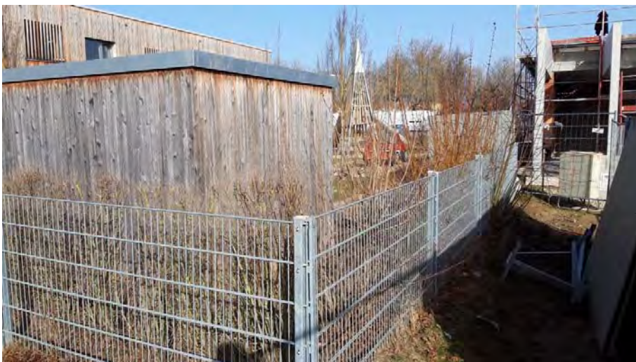
Abb. 12: Ziergehölze und niedrige Hecken entlang der Zäune