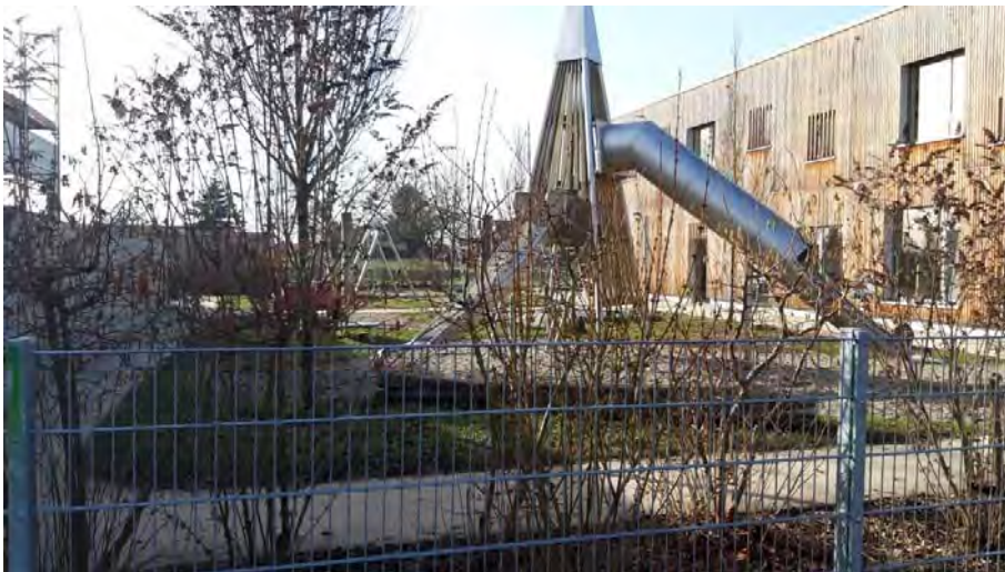
Abb. 6: Freigelände Kindergarten