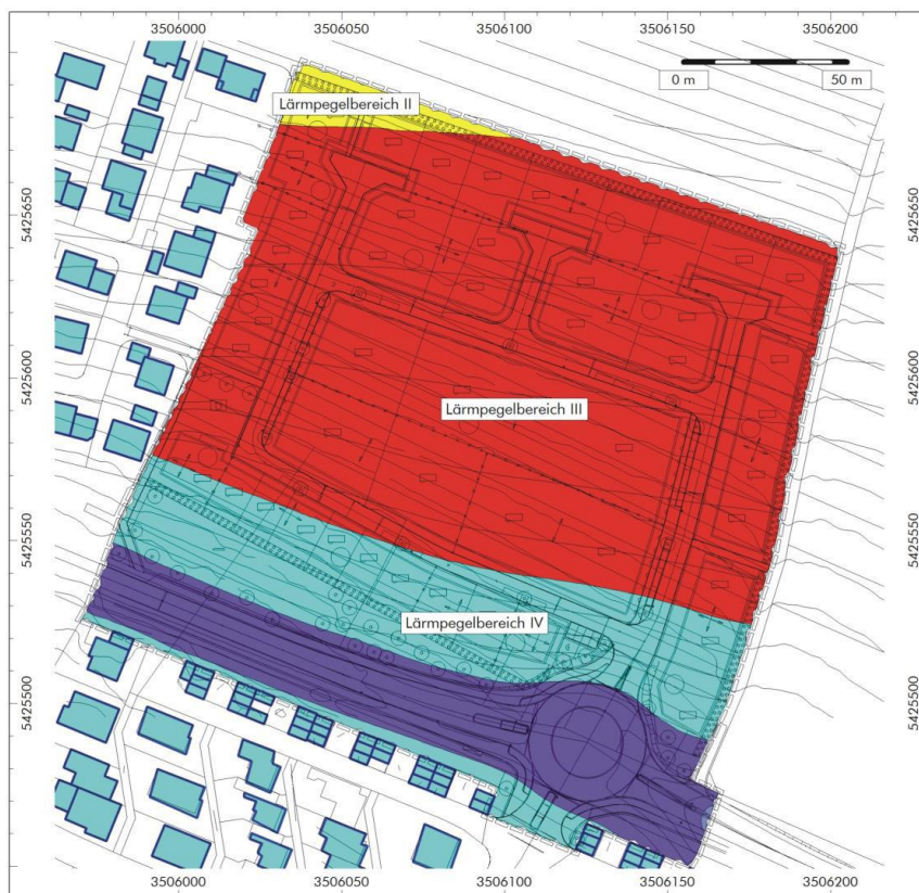
Abbildung 6: Immissionshöhen 7,5 m über Gelände