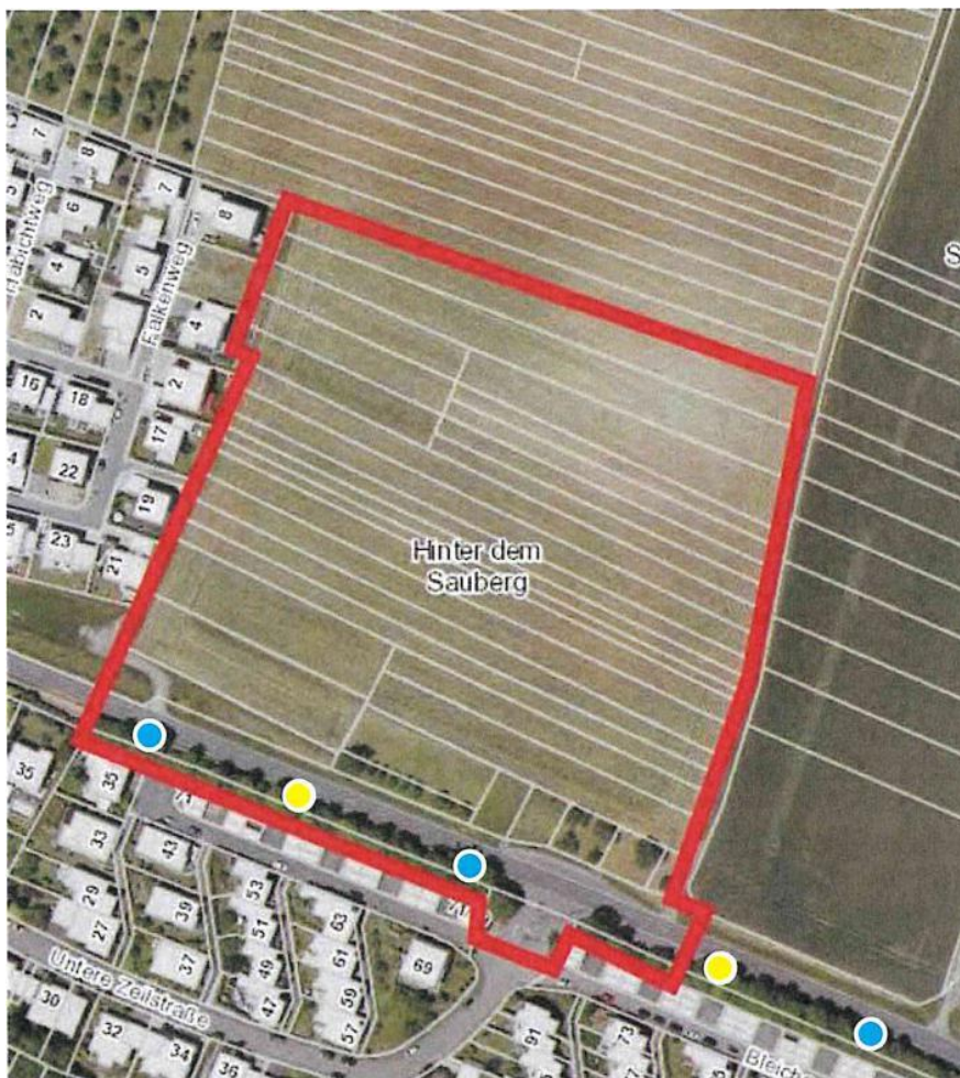
Abbildung 1: Flst. Nr. 596/2 Gemarkung Kleinsachsenheim Beispiele für geeignete Standorte zum Anbringen von Nisthöhlen für baumhöhlenbewohnende Vogelarten (blau = Typ Schwegler 1 B, 0 26 mm, gelb = Typ Schwegler 1 B, 0 32 mm)