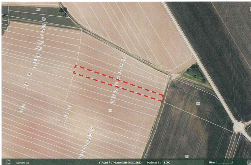
Abbildung 2: CEF-Maßnahme CEF 2 - Anlage von Buntbrachen - Kleinsachsenheim, Flst. Nr. 670, Gemarkung Kleinsachsenheim, Größe ca. 828 m 2

Die Feldlerche brütet mit sechs Brutpaaren im Untersuchungsgebiet. Dabei ergibt sich für zwei Brutpaare eine direkte Betroffenheit durch den Bebauungsplan „Birkenfeld“, da die Vorkommen in unmittelbarer Nähe liegen. Die Verluste von Fortpflanzungs- und Ruhestätten der Feldlerche sind durch die Anlage von zwei dauerhaften Brachflächen (Buntbrache) mit einer Gesamtgröße von ca. 2.137 m 2 in den Ackerflächen westlich von Kleinsachsenheim auf den Flst. Nrn. 670 und 1227, Gemarkung Kleinsachsenheim zu kompensieren. Der Abstand zu vertikalen Strukturen muss mindestens 60 m und zu geschlossenen Gebäude- und Waldkulissen mindestens 120 m betragen. Die CEF-Maßnahme ist vorgezogen umzusetzen.