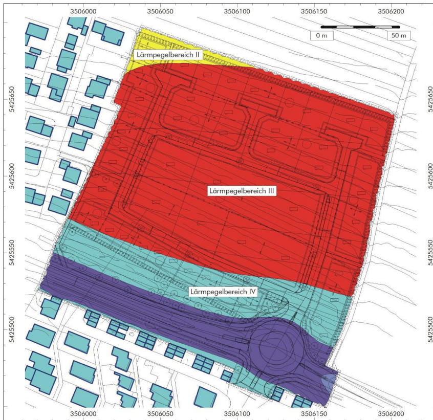
Abbildung 5: Immissionshöhen 5 m über Gelände