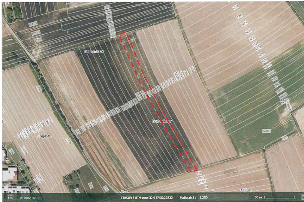
Abbildung 3: CEF-Maßnahme CEF 2 - Anlage von Buntbrachen - Kleinsachsenheim, Flst. Nr. 1227, Gemarkung Kleinsachsenheim, Größe : 1.309 m 2